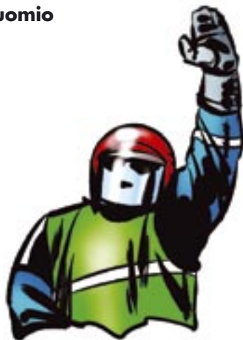
Käsi suorana ylös ojennettuna