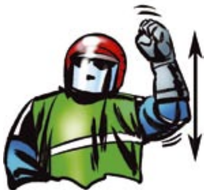
Käden ylös-alasliike suorassa kulmassa